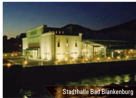
Stadthalle Bad Blankenburg