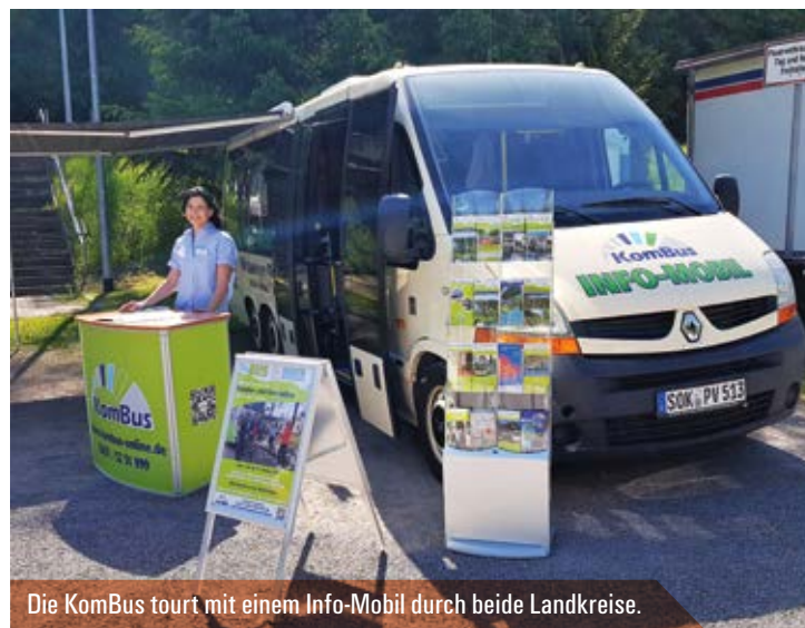
Die KomBus tourt mit einem Info-Mobil durch beide Landkreise.

Die KomBus mit ihren über 250 Busfahrerinnen und Busfahrern bleibt ein vertrauter Dienstleister in der Region. Leistungen der anderen VMT-Partner erweitern ab 13.12.2020 das Nahverkehrsangebot aus einer Hand. Die Fahrt mit Bus, Zug und Straßenbahn wird erheblich einfacher.