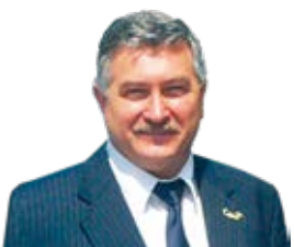
Geschäftsführer der KomBus GmbH