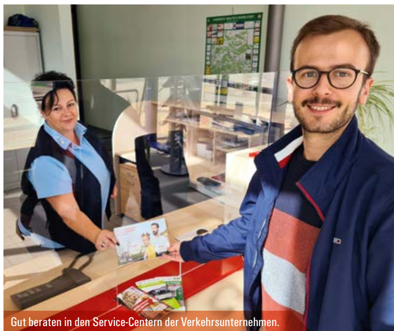
Gut beraten in den Service-Centern der Verkehrsunternehmen.

Faltblätter des VMT informieren über die Verbunderweiterung, Abos und Tarife, Tarifzonen und die komplette Preistabelle. An den Haltestellen der KomBus werden Fahrgastinformationen über den VMT ausgehängt. Gedruckte Medien sind in Bussen und Service-