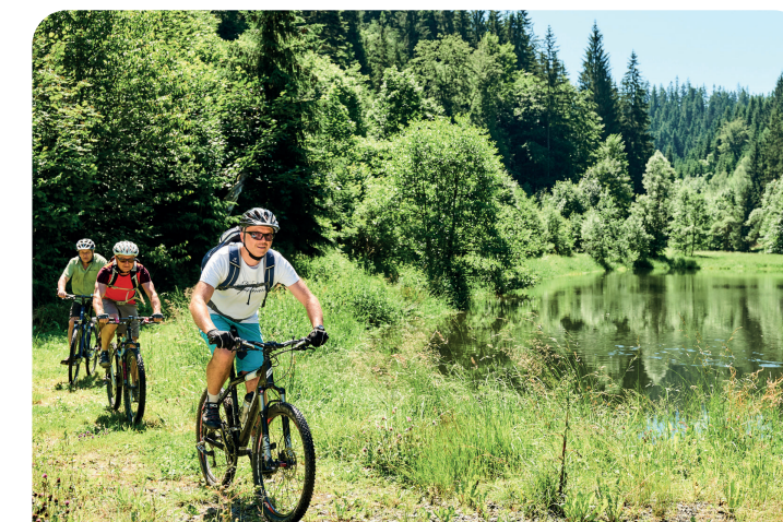
Radfahren im Frankenwald