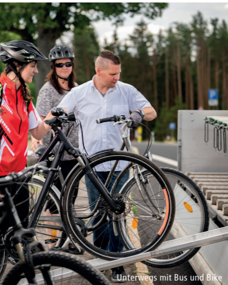
Unterwegs mit Bus und Bike

F verkehrt nur in den Ferien S verkehrt nur an Schultagen Ⓜ in Saalfeld, Krankenhaus Umstieg in Richtung KomBus-Gewerbegebiet möglich Ⓜ Bedarfshaltestelle 5 min bis 15 min vor Fahrtantritt Anforderungsknopf betätigen