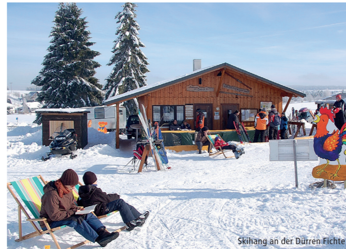
Skihang an der Dürren Fichte

Weitere Infos: www.rennsteigregion-neuhaus.de , Schneetelefon: 0800- 7236488 (kostenfrei), "SchneeApp" Thüringer Wald