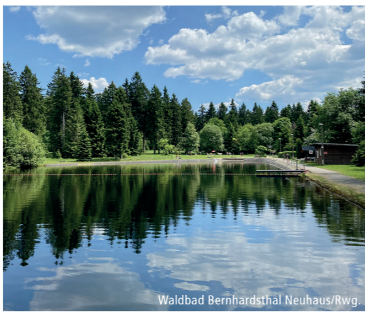
Waldbad Bernhardtsthal Neuhaus/Rwg.

☐ Bus verkehrt vom 28.03. - 31.10.2024 mit Fahrradanhänger mit Platz für 15 Fahrräder (Anmeldung am Servicetelefon 03671-5251999 bis freitags, 12 Uhr bzw. vor Feiertagen einen Werktag zuvor bis 12 Uhr erforderlich); für Radlergruppen ab 16 Personen bitte Anmeldung bis zwei Wochen vor dem gewünschten Termin; Ⓜ in Saalfeld, Krankenhaus Umstieg aus Richtig. KomBus-Gewerbegebiet möglich Ⓜ Bus verkehrt vom 28.03. - 31.10.2024 mit Fahrradgepäckträger mit Platz für fünf Fahrräder (Anmeldung am Servicetelefon, siehe oben); Ⓜ in Saalfeld, Krankenhaus Umstieg aus Richtig. KomBus-Gewerbegebiet möglich Ⓜ verkehrt nicht am 24.+31.12. Ⓜ Bedarfshaltestelle 5 - 15 min vor Fahrtantritt Anforderungsknopf betätigen