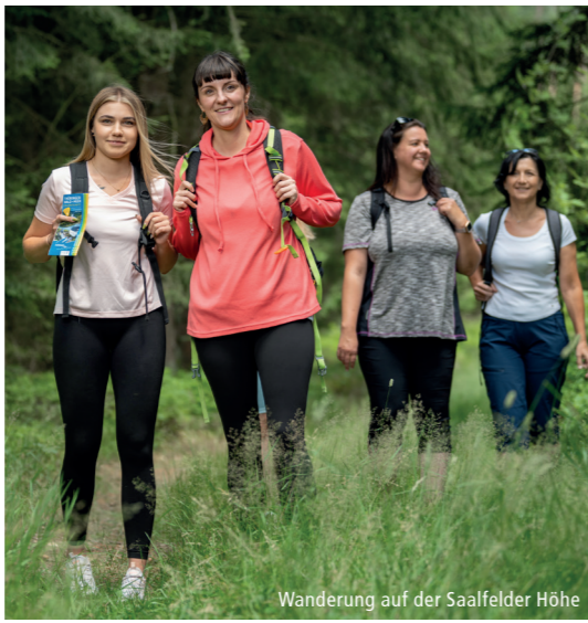
Wanderung auf der Saalfelder Höhe

☐ nur zum Aussteigen Ⓜ in Saalfeld, Krankenhaus Umstieg aus Rtg. KomBus-Gewerbegebiet möglich Ⓜ Bedarfshaltestelle 5 bis 15 min vor Fahrtantritt Anforderungsknopf betätigen Bitte beachten Sie, dass es in der Saison 2024 im Verlauf der KomBus-Linie 405 wegen Straßenbaumaßnahmen und Sperrungen zu Fahrplanänderungen kommen kann. Bitte informieren Sie sich vor Fahrtantritt an unserem Servicetelefon, in den Servicecentern oder unter www.kombus-online.eu