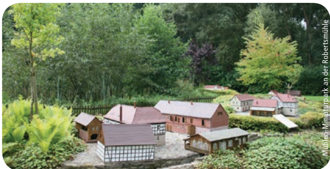
Mühlen-Miniaturpark an der Robertsmühle

weitere Infos: www.keramik-museum-buergel.de / www.saaleland.de