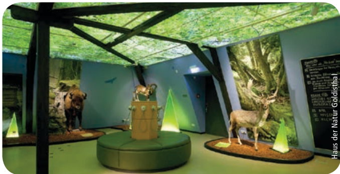
Haus der Natur Goldisthal

weitere Infos: www.rennsteig-schwarzatal.de / www.hausdernatur-goldisthal.de