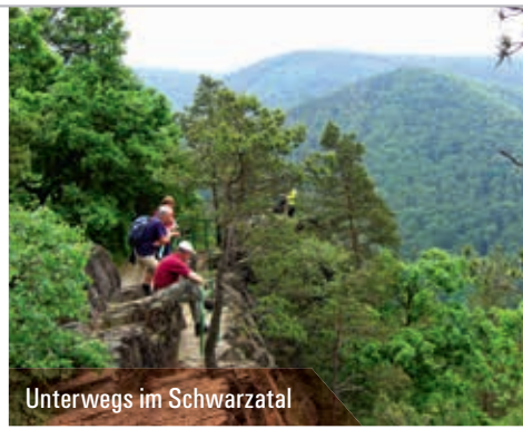
Unterwegs im Schwarzatal

In SCHMIEDEFELD können Sie die Morassina , eine märchenhafte Welt „unter Tage“ bestaunen, die auf der Grundlage bergbaulicher Arbeit vor Jahrhunderten und dem Wirken der Natur